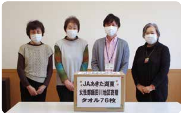
〈JAあきた湖東女性部飯田川地区〉