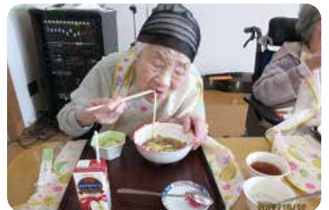
出来立てのだまご鍋を皆さんでおいしくいただきました。おかわりをされた方もいて、大変満足された様子でした。