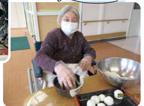
おいしく 作っているよ～