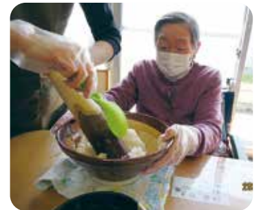
新米をすり鉢でつぶしている様子。皆様一生懸命にすりこぎ棒で潰されております。