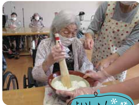
よいしょ! * よいしょ!