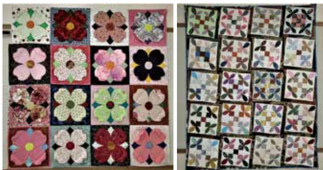
パッチワーク 布遊の会様