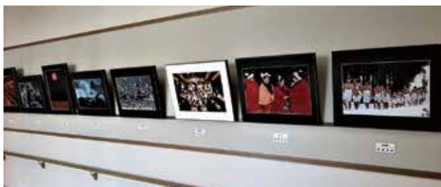
大切な作品をお借りして、展示しております