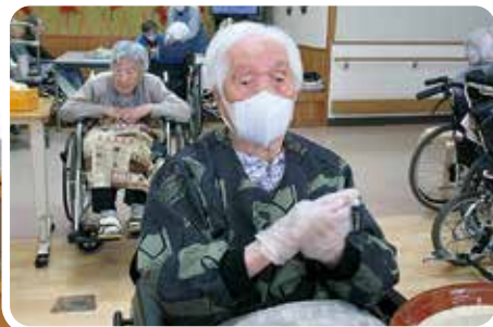
だまごを丸めている様子。『おいしくなあれ～』と願いを込めて丸められておりました。