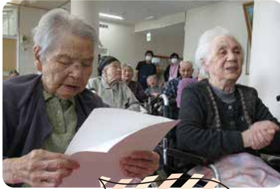
「秋の夕日に～ てる山もみじ～♪」