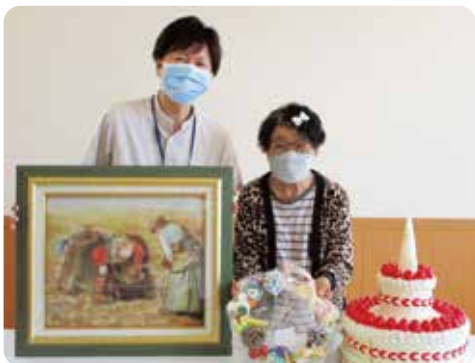
〈粘土・スイーツデコ教室〉