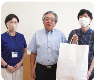
〈潟上市昭和地区民生児童委員〉